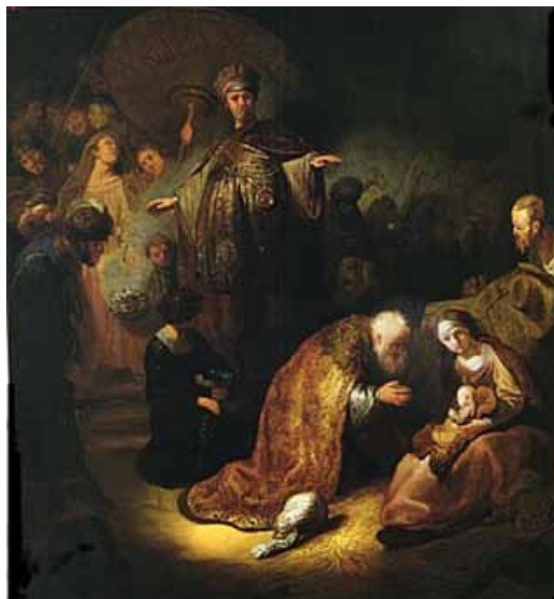
Rembrandt van Rijn (16. stol.)

Za slovenske upodobitve v srednjem veku je dobil trikraljevski motiv – kakor piše France Stele – svoj prvi vzorec v Zahodni Evropi proti koncu 13. stoletja: pred sedečo Marijo z Detetom kleči stari kralj brez krone in daruje, druga dva stojita in eden kaže zvezdo. Menijo, da so se umetniki pri tem načinu vzgledovali po obrednih trikraljevskih igrach, zato imenujejo ta tip upodobitve "igrski" tip. Hkrati pa se je razvil – nadaljuje Fr. Stele – na portalih zahodnoevropskih stolnic še en način, ki predstavlja v pripovedni širini odhod treh kraljev iz njihove domovine, njihov sestanek s Herodom, poklonitev Detetu in vrnitev domov. Ta tip upodobitve imenujejo zgodovinski, historični tip. Skoraj vse ohranjene srednjeveške podobe na Slovenskem so zasnovane po tem tipu. Gre vseskozi za mogočne prikaze, ki zavzemajo dostikrat cele stene cerkvenih notranjščin – redkeje zunanjščin – in so nastajali od srede 14. do srede 16. stoletja. Mnogo teh podob je le deloma ali pa slabo ohranjenih. Med pomembnimi je podoba na severni strani cerkve sv. Miklavža nad Čadramom, še bogatejše so slikarije postavim v Mačah (1476), na Krtini (ok. 1460) in podoba na severni