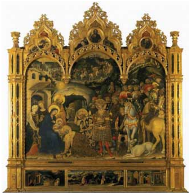
Gentile da Fabriano (14. stol.)

"Modri" z Vzhoda so za Cerkev slejkoprej le "modri", magi, tudi ni znano njihovo število. Stari krščanski viri o njih ne vedo povedati nič zanesljivega.