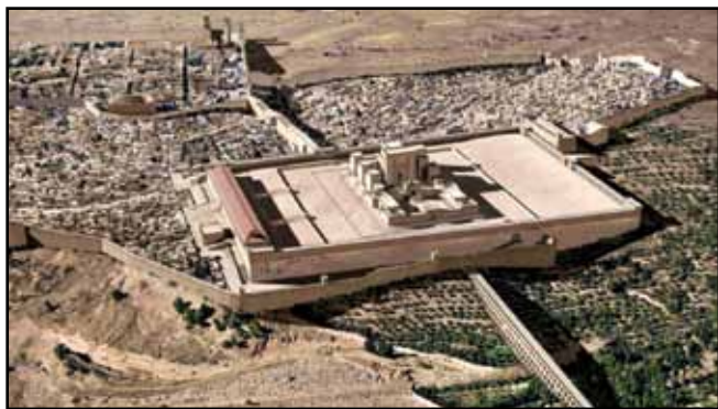
Jeruzalem v Jezusovem času

bila obilna cenitev, pa je pri tem všteti še kakih 500.000 Samarijanov, Edomcev in Moabčanov, Grkov v Dekapolisu, pa meščancev na raznih krajih. Leta 1922 so na istem področju našli 761.796 prebivalcev.