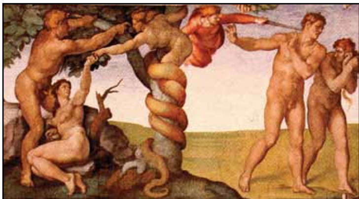
Prepovedani sad – izgnana iz raja (Michelangelo v Sikstinski kapeli)

s tem, da nam je naprtil krivdo, ki jo je zagrešil en sam človek. Zakaj moramo nositi posledice kršitve božje zapovedi v raji mi, ki nimamo na sebi druge krivde kot te, da smo potomci začetnikov človeštva?