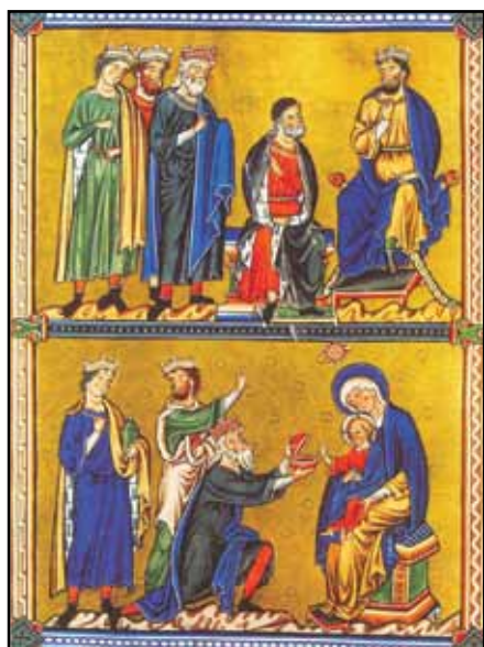
Modri pri Herodu Poklonitev Modrih (bizantinska ikona)

Ta praznik je bil sprva osrednji in edini krščanski praznik "božičnega časa", saj je moralo poteči