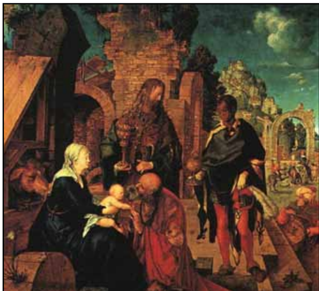
Albrecht Dürer (15. stol.)

srečamo šele na mozaičnem tlaku stare vatikanske bazilike iz začetka 8. stoletja. Njihovo število se je spreminjalo. Sirsko izročilo in druga izročila na vzhodu jih naštevajo dvanajst, na Zahodu pa se je ustalilo izročilo o treh "kraljih", pač po darovih, ki jih našteva evangelist (zlato, kadilo, mira). V troje jih srečamo prvič na podobi v katakombi sv. Priscile iz 2. stoletja. Nazadnje je obveljalo število tri, tako od 12. stoletja dalje govore viri samo o "svetih treh kraljih", čeprav ni gotovo, da so bili trije, čeprav niso bili kralji in čeprav niso bili razglašeni za svetnike... Tudi glede imen je bila zmeda sprva neizbežna; nazadnje so pač obveljala imena: Kaspar, Melhior, Baltazar.