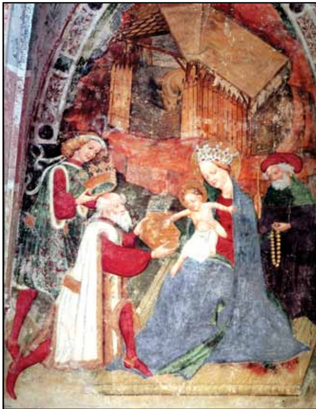
Št. Janž nad Dravčami (Vuzenica, 15. stol.)

steni muljavske cerkve, delo Janeza Ljubljanskega (1456). Na teh podobah dobiva zgodba o sv. treh kraljih čisto srednjeveški viteški značaj in odseva zlasti s svojimi lovskimi prizori viteško življenje tistih časov. Zelo mikavna, zlasti po mnogih žanrskih dodatkih je tudi freska na severni steni cerkve v Hrastovljah pri Kopru, ki jo je leta 1490 naslikal istrski mojster Janez iz Kastva. Vrh pa predstavljata znana podoba pri Sv. Primožu nad Kamnikom (ok. 1520), ki zavzema nad 11 metrov dolgo severno steno te romarske cerkvice, in podoba na južni strani v Marija Gradcu pri Laškem (1526).